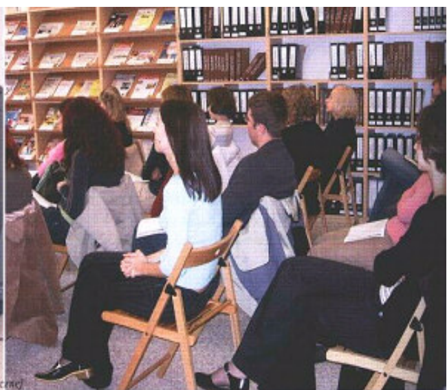
Na zdjęciach: w Centrum Informacji Biznesowej i Europejskiej w Wojewódzkiej Bibliotece Publicznej